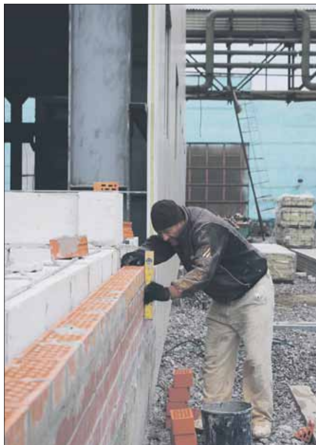
На строительстве нового цеха.